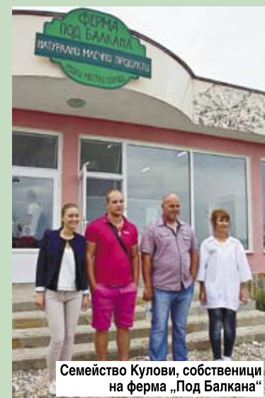
Семейство Кулови, собственици на ферма „Под Балкана“

ОСНОВА = 6 КОЛ. ВИСОЧИНА = 130 ММ ЦВЕТНОСТ: СМУК