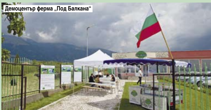
Демоцентър ферма „Под Балкана“

ПРОДУКТИ: кисело мляко и сирене от биволско, краве, овче и козе мляко. Биволска мътеница, кефир и масло.